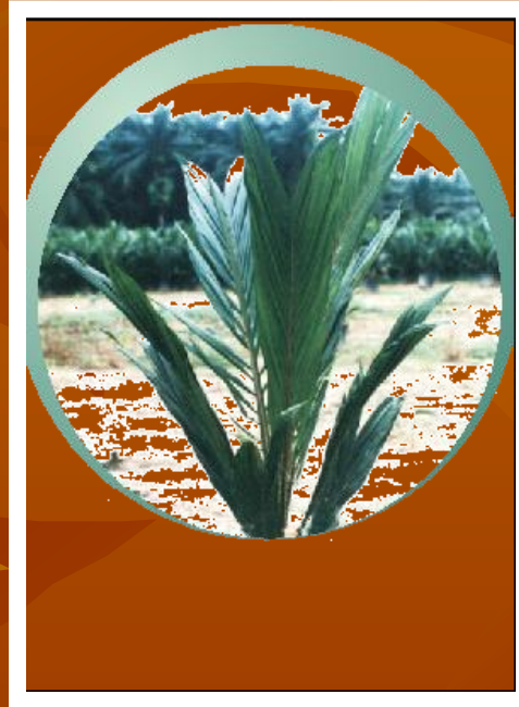
CRECIMIENTO Y ELONGACIÓN